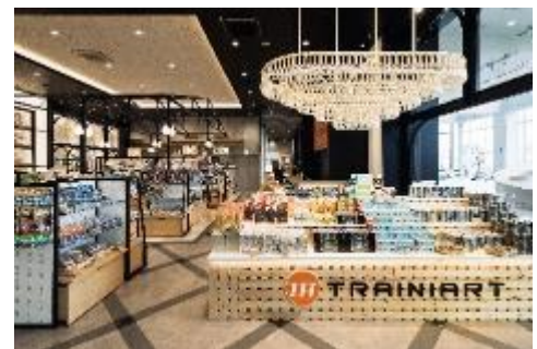
▲ TRAINIART (トレニアート) 店内