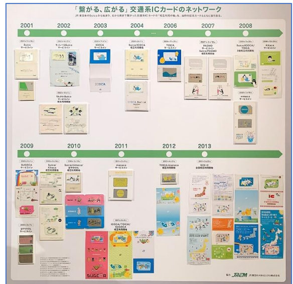
▲ 展示参考イメージ