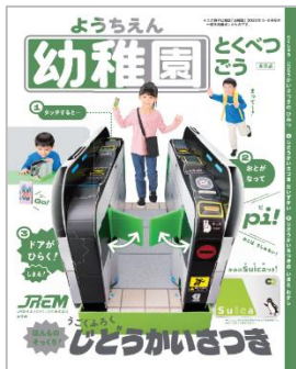
▼ 参加記念品の一例

参加記念品：先着 400 名さまには JR 東日本メカトロニクス(株)提供、小学館「幼稚園」特別号 (改札機工作キット付録付き)、それ以降は交通系 IC カードのキャラクターグッズや鉄道グッズなどから、お一人さまおひとつプレゼントします。